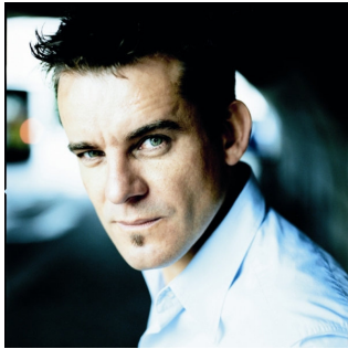
Bart Moeyaert liest aus Hotel „Du bist da, Du bist fort“